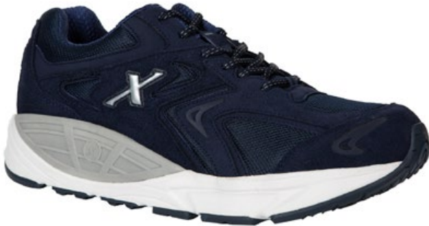
Navy XX35305 Größe 42 - 47 in ganzen Größen Weite D Mesh / Suede