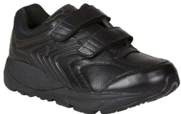
Men's Black XX84227 Weite D / Größe 39 - 48 / ganze Größen Weite 2E / Größe 42 - 46 / ganze Größen