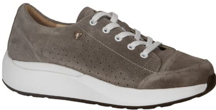
Fawn - XX22263 Nubuck Leder

Die Xelero Swiss Collection kombiniert Stabilität und Comfort mit einer dynamischer Bewegung. Die Zehenbox bietet extra viel Platz für den Vorfuß. Mit den Heidi-Modellen gehen Sie leichter und können länger schmerzfrei gehen. Die Sohle der Heidi-Modelle haben eine rutschfeste Sohle.