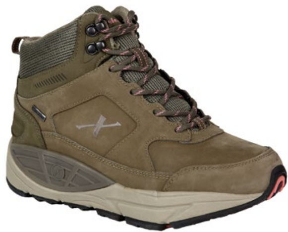
Ladies' Mocha XX72324 Größe 37 - 44 in ganzen Größen Weite B Wasserfestes Nubuck Leder