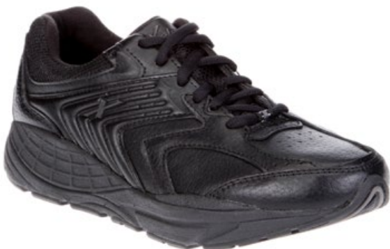
Men's Black XX84607 Weite D / Größe 39 - 48 / ganze Größen Weite 2E / Größe 42 - 46 / ganze Größen

Der Xelero Matrix Leder eignet sich ausgezeichnet für sportliche Aktivitäten wie Walken, Gehen und leichtes Wandern auf flachem Untergrund bei jedem Wetter. Die Außensohle ist ausgerichtet für Straße und leichtes Gelände. Wie alle Xelero Schuhe verfügt der Matrix Leder über die patentierte XRS-Technology. Diese sorgt für eine dynamische und zugleich seitlich stabile Abrollbewegung. Muskuläre Disbalancen werden reduziert, Gehen und Stehen werden spürbar angenehmer. Die Gefahr von Misstritten wird massgeblich reduziert. Das Obermaterial aus Leder verleiht dem Fuss den nötigen Halt.