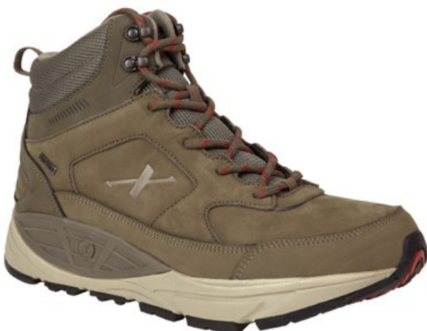
Men's Mocha XX76314 Größe 41 - 48 in ganzen Größen Weite D Wasserfestes Nubuck Leder

Der Hyperion ist der erste niedrige Outdoorschuh von Xelero, speziell geeignet für Walking im Gelände. Die abriebfeste, schneetaugliche Außensohle verleiht jedem Schritt den nötigen Halt. Wie alle Xelero Schuhe verfügt der Hyperion über die patentierte XRS-Technologie. Diese eignet sich nicht nur in der Dynamik für lange Strecken im leichten Gelände, sondern sorgt auch für die seitliche Stabilität auf unebenem Untergrund. Das Obermaterial ist aus einem Nylon/Ripstop- und Leder-Material, atmungsaktiv und zugleich wasserabstoßend und somit wetterresistent.