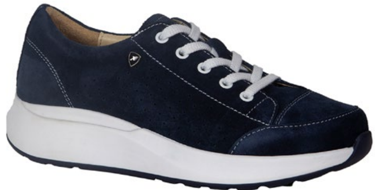
Deep Ocean - XX22245 Nubuck Leder